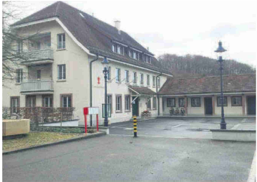
Die Gemeinde Bettingen – hier das Gemeindehaus – sieht ihre fortschrittliche Energiepolitik mit dem Energiestadt-Label belohnt.

Verschiedene Massnahmen zeichnen Bettingen als Energiestadt aus. Als energiepolitisch vorbildliche Massnahme wird beispielsweise die grosszügige Unterstützung des Ruftaxis gewertet. Diese stellt eine optimale Ergänzung zum bereits sehr guten ÖV-Angebot dar und ermöglicht die Nutzung des öffentlichen Verkehrs auch zu später Stunde. Eine weitere Massnahme ist die Raumplanung, welche für Neubauten den Minergiestandard vorschreibt. Gegenüber den kantonalen Vorschriften sind die energetischen Anforderungen in Bettingen dadurch um zehn Prozent strenger. Wird ein Neubau nach dem Minergie-P-Standard und eine Sanierung nach dem Minergiestandard erstellt, erhält der Bauherr als Bonus eine Erhöhung der Nutzungsziffer um zehn Prozent. Auch die Gratisabgabe der Grünabfälle wird von der Gemein-