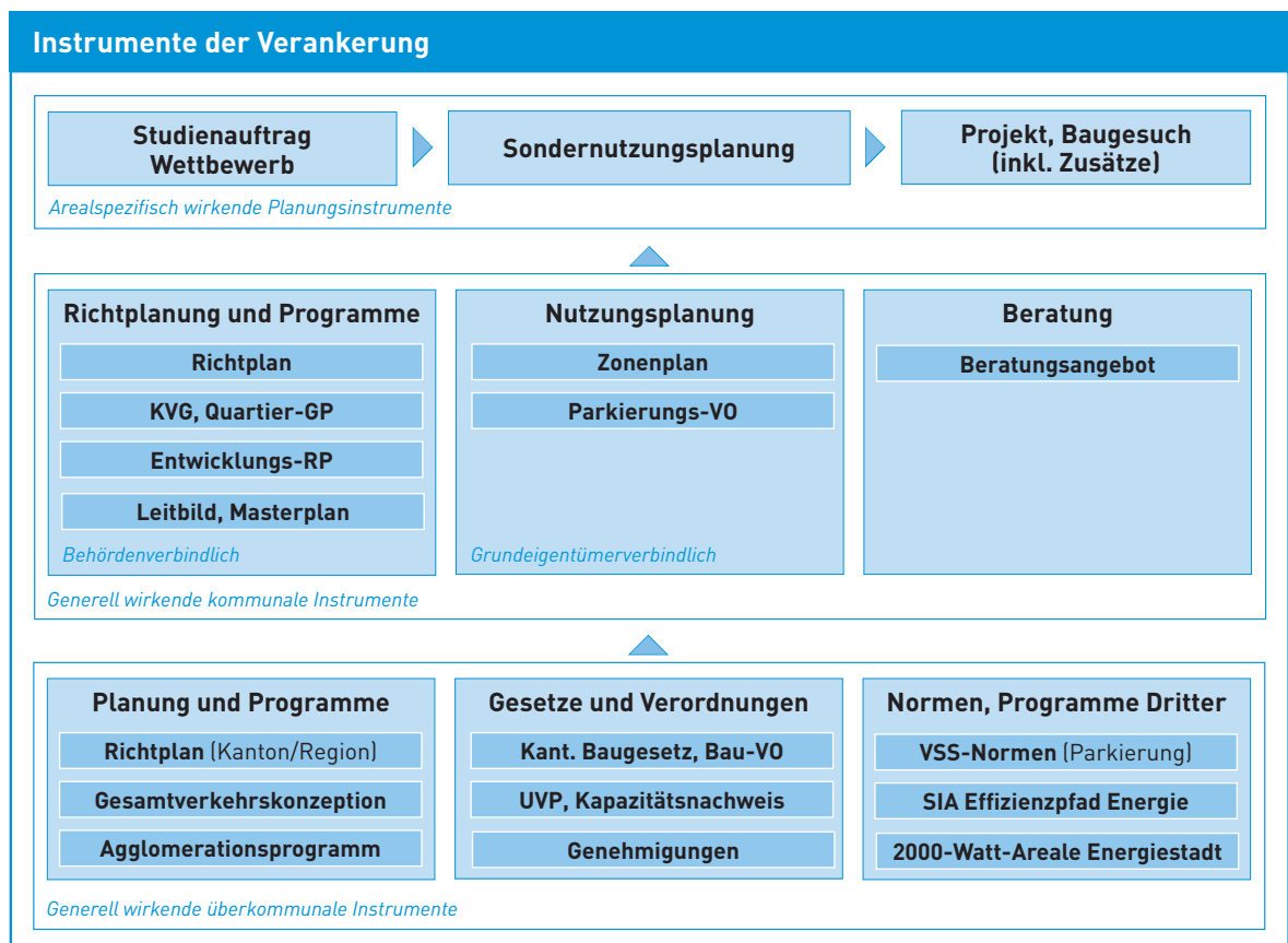
Abbildung 2.1: Die Instrumente der Verankerung im Überblick

Die nachstehende Abbildung vermittelt einen Überblick über den Prozess und die darin verwendeten Instrumente der Verankerung. Die Darstellung der Instrumente erhebt keinen Anspruch auf Vollständigkeit. Für Abkürzungen wird auf die nachstehenden Kapitel und das Glossar im Anhang verwiesen.